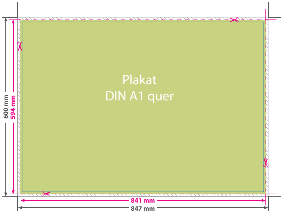
Plakat DIN A1 quer