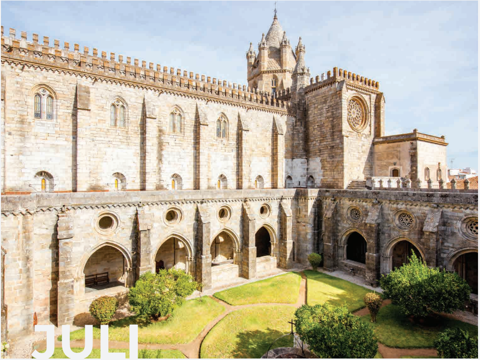
Kathedrale von Évora / Évora - Portugal