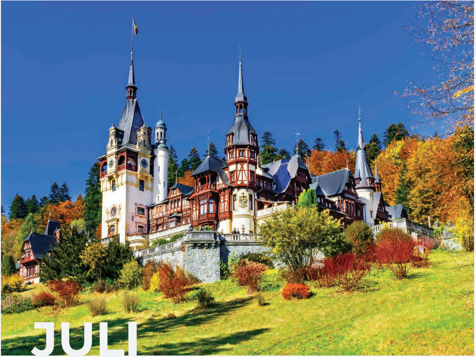
Schloss Peleş / Sinaia - Rumänien