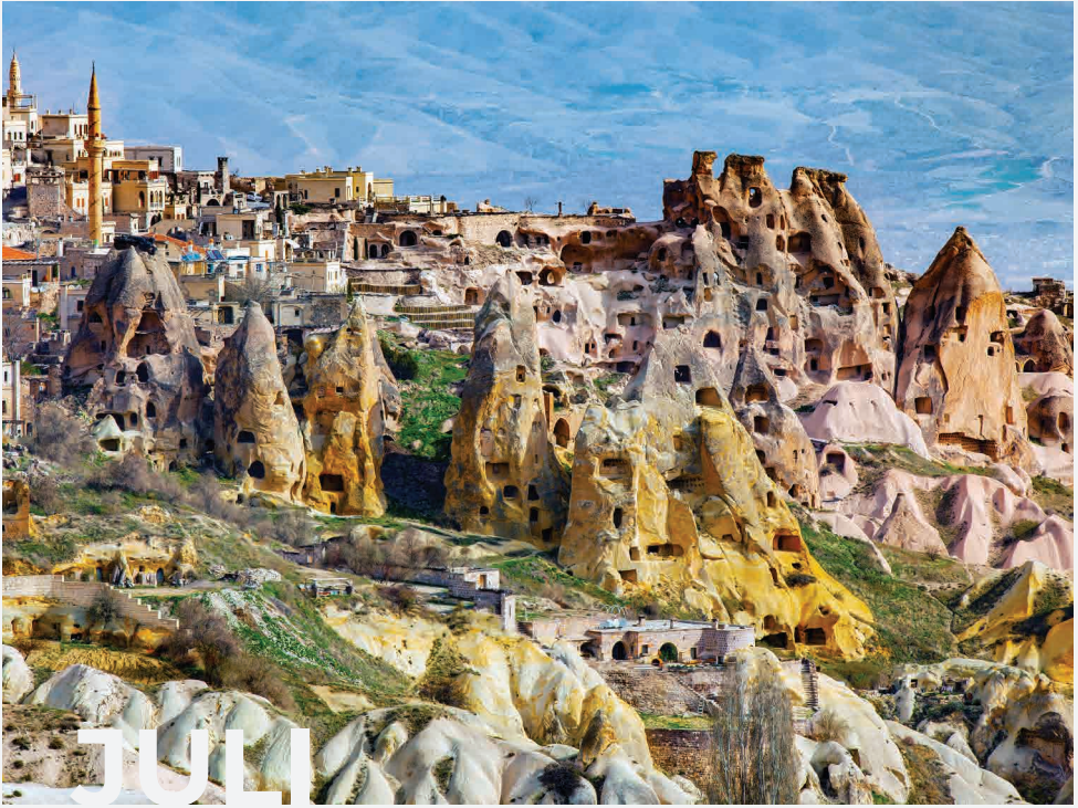
Höhlen von Kappadokien / Göreme - Türkei