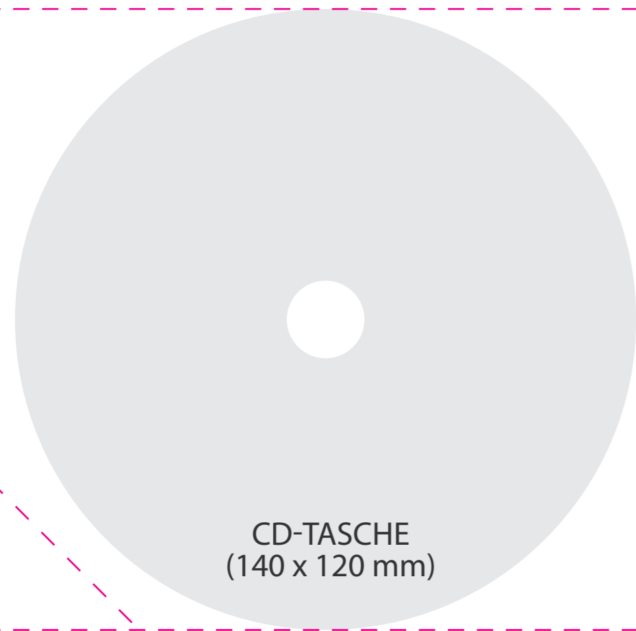
CD-TASCHE (140 x 120 mm)