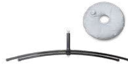
Kreuzfuß mit Wassertank